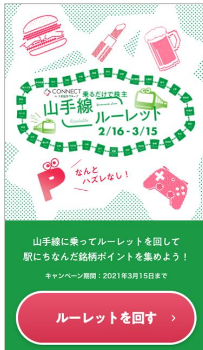
(ルーレット参加画面)